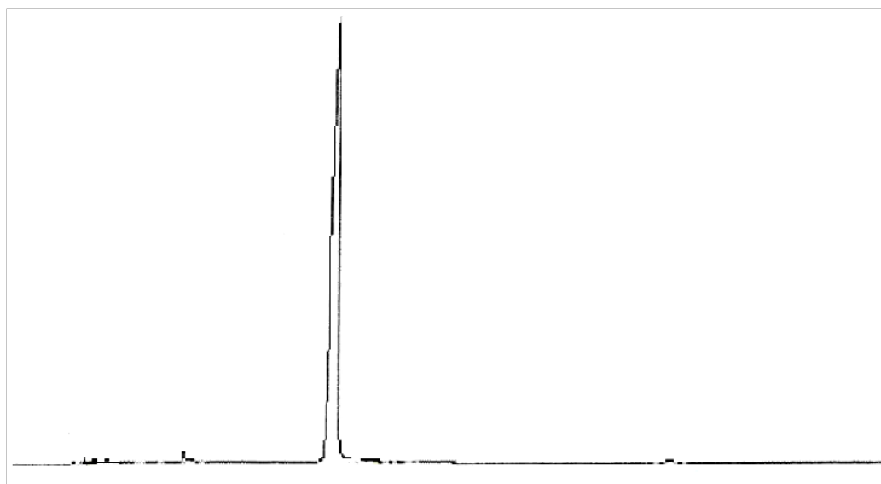
图 B.1 食品添加剂二糠基二硫醚气相色谱图